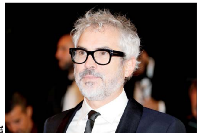
Repaso. No es la primera vez que Cuarón trabaja para televisión, puesto que cocreó el drama Believe para la NBC en 2014.

Asimismo, se han dado a conocer colaboraciones con artistas como Jennifer Aniston, Chris Evans y Jason Momoa.