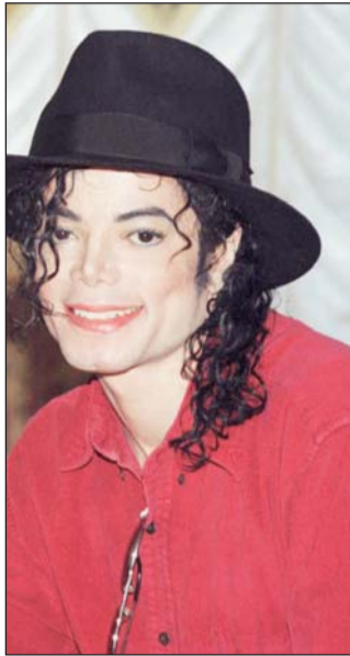
Fama. En vida, Jackson obtuvo el título de 'El rey del pop'.