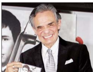
La gala será a cabo en el Centro James L. Knight en Miami.

"El legendario cantante mexicano será homenajeado con un tributo que incluirá presentaciones especiales por parte del cantante y actor Pablo Montero, además de otras sorpresas", señaló el Salón de la Fama. (AGENCIAS)