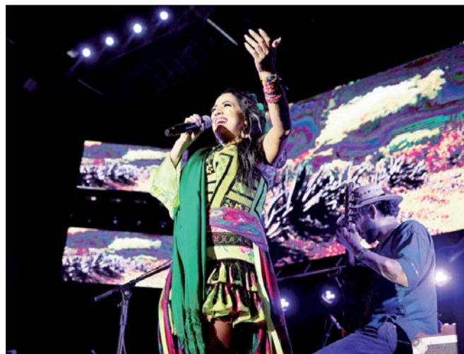
Especial. La mexicana Lila Downs será una de las intérpretes que reciba el Leading Ladies of Entertainment.

"Es una distinción y reconocimiento que reciben mujeres profesionales y con gran consciencia social en el campo de las artes y el entretenimiento y que han hecho importantes aportes e inspiran a la próxima generación de mujeres líderes", detalló la Academia Latina en un comunicado. Se trata de la tercera