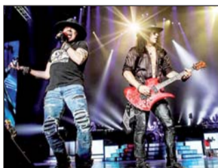
La mítica banda de rock visitará Brasil, Argentina y Chile.

En Chile, la décima edición de Lollapalooza se realizará del 27 al 29 de marzo, las mismas fechas que en Argentina, donde el festival se hará por séptima vez. Del 3 al 5 de abril el espectáculo se trasladará a Brasil, donde alcanzará la novena edición. (AGENCIAS)