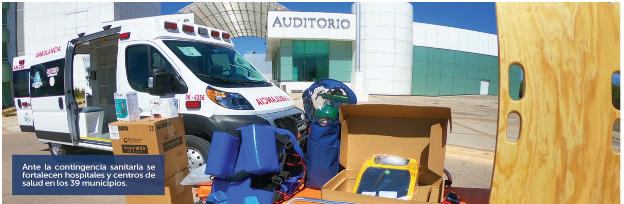
Ante la contingencia sanitaria se fortalecen hospitales y centros de salud en los 39 municipios.