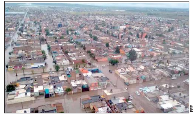
Emergencia. El Fondo de Desastres Naturales, uno de los 44 fideicomisos que se pretende desaparecer, denuncia.

“Pero esta es una decisión que no depende del INE, sino que depende en muchas maneras de lo que las autoridades en materia de salud nos digan a nosotros”.