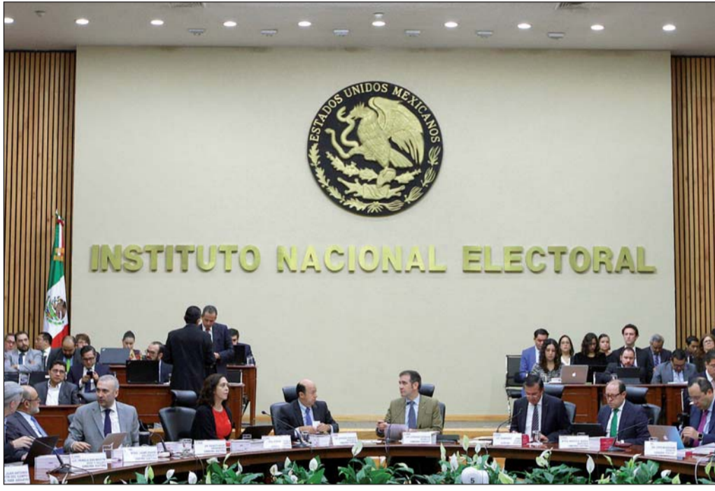
Fechas. El consejero presidente del INE, Lorenzo Córdova, asegura que no se prevé que la emergencia económica posponga el Proceso Electoral Federal (PEF) 2020-2021.

“No podemos imponer la democracia en contra del derecho a la salud, así que si es necesario posponer elecciones pues que se pospongan. Ahora, obviamente para las elecciones del próximo año nosotros estamos planeando no moverlas, y