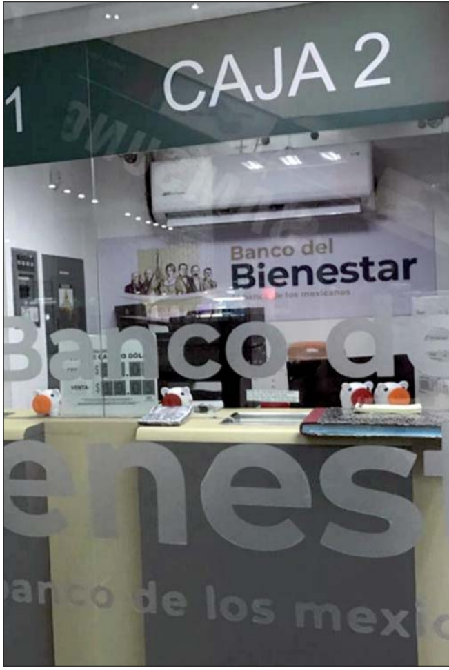
Proyecto. Está totalmente descartada una reforma para que el Banco del Bienestar administre el Ahorro para el Retiro.

Vela agregó que está totalmente descartada una reforma para colocar al Banco del Bienestar como el único administrador de los 4 billones 55 mil 332 millones de pesos que existen en el Sistema de Ahorro