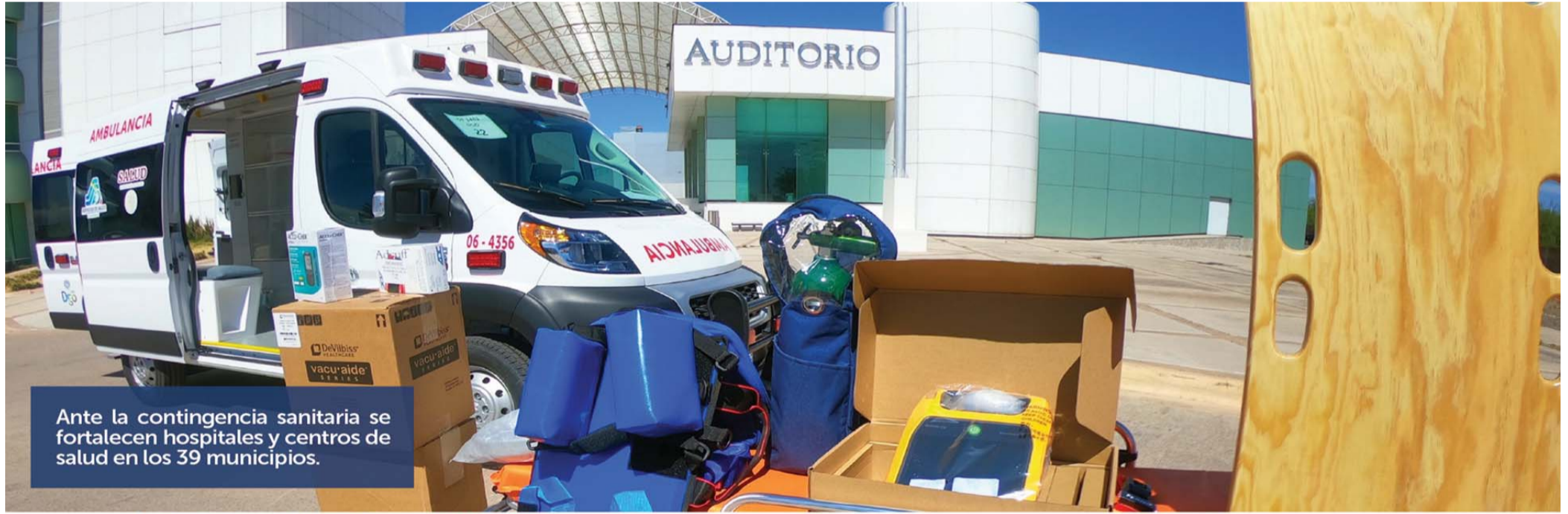
Ante la contingencia sanitaria se fortalecen hospitales y centros de salud en los 39 municipios.