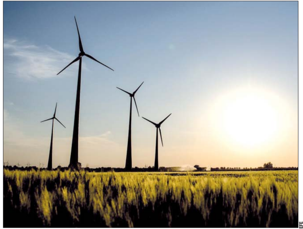
Proyectos. El acuerdo afectará proyectos eléctricos en 18 estados con una inversión total de más de 30 mil millones de dólares, según el Consejo Coordinador Empresarial (CCE).

El pasado martes, las empresas energéticas presentaron recursos de amparo ante este juzgado contra el polémico acuerdo del Cenace, gestor público del sistema