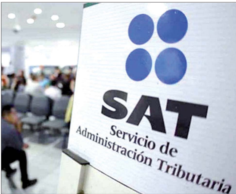
Recurso. Fueron mil millones de pesos más que en el mismo periodo del año anterior.

Además, peligran 44 proyectos en construcción con más de 6.400 millones de dólares de inversión, denunciaron la Asociación Mexicana de Energía Solar (Asolmex) y la Asociación Mexicana de Energía Eólica (Amdee).