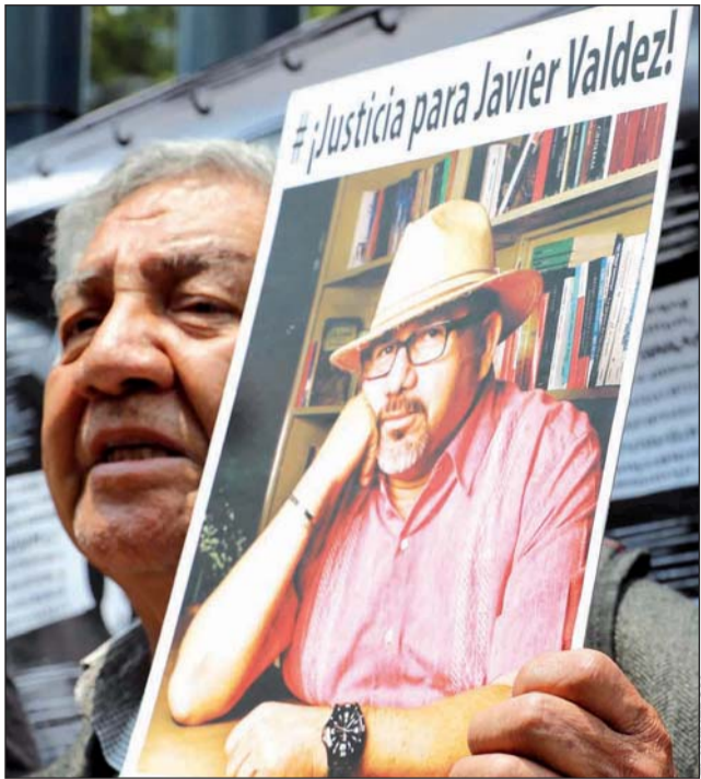
Decisión. El grupo parlamentario de Morena se retractó de la iniciativa, de acuerdo a la Secretaría de Gobernación.