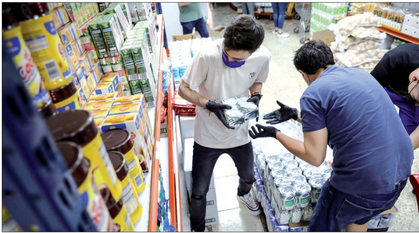
Situación. La OIT recomienda en su informe la aplicación de algunas recetas que ya se tuvieron en cuenta tras la crisis de 2008, basadas en "políticas fiscales expansivas que puedan estimular la economía y apoyar la creación de empleo".