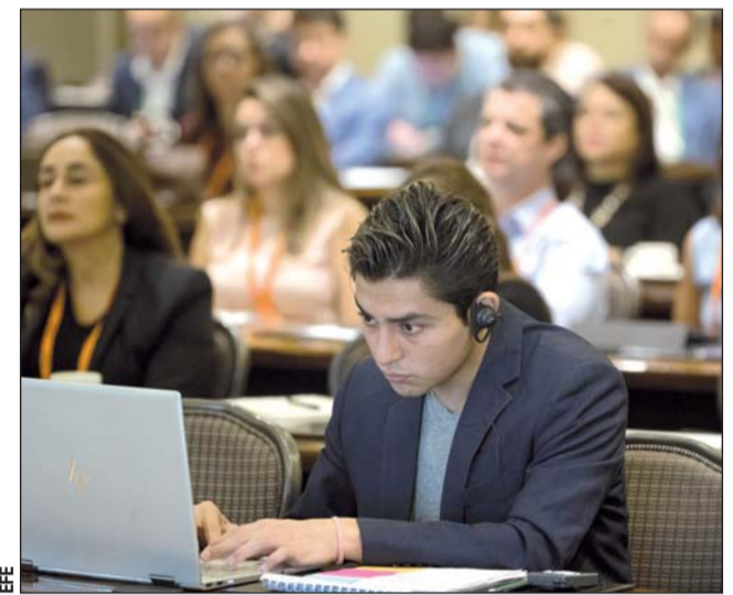
Herramienta. El programa ayudará en caso de disputas por propiedad intelectual.

Independientemente de que vayan o no a ser registrados como propiedad intelectual utilizando los canales tradicionales de la OMPI, "estos contenidos deberían tratarse como activos intelectuales", razón por la cual se crea el servicio WIPO PROOF.