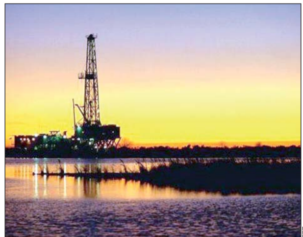
Caída. Petróleos Mexicanos no está dando los resultados esperados, dijo la Comisión Nacional de Hidrocarburos.

En materia de inversiones, se estimaron 65 mil 614 millones de pesos, pero sólo se ejercieron 37 mil 285 millones, lo que representa una caída de 43%.