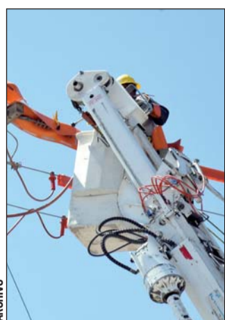
Costo. La CFE solicitó aumentar de inmediato los costos de transmisión que las compañías privadas pagan por utilizar la infraestructura de compañía nacional.