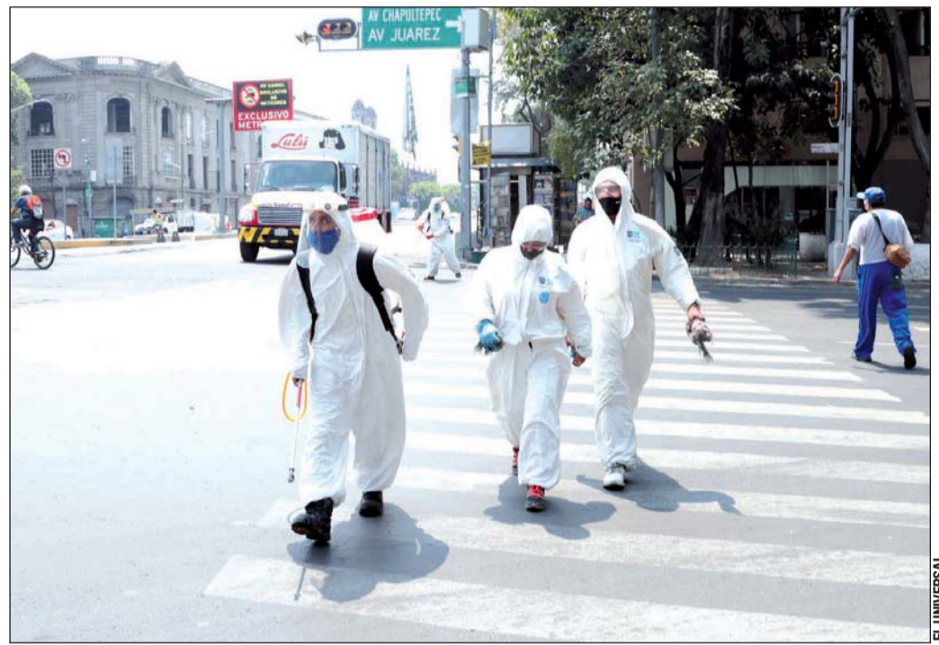
Confinamiento. México terminará este 30 de mayo las jornadas de sana distancia para mitigar la propagación que comenzaron en marzo pasado.

En México se presentó una ocupación de camas generales de hospital del 40 por ciento y de un 36 por ciento en las camas de terapia intensiva, en ambos ca-