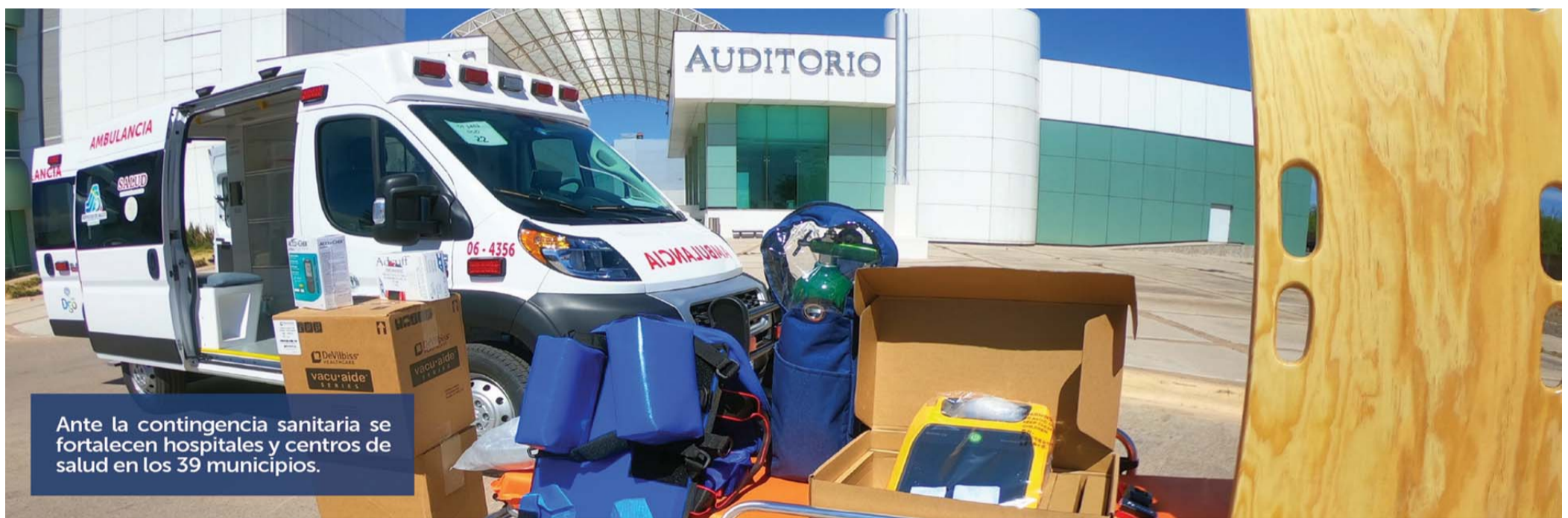
Ante la contingencia sanitaria se fortalecen hospitales y centros de salud en los 39 municipios.

sea en 10 por ciento de los enfermos no graves y al 100 por ciento de los que están en estado de gravedad.