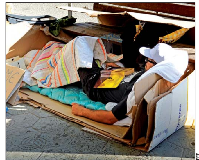
Pobreza. El Fondo servirá para amparar a cuatro de cada cinco personas que en España sufren pobreza severa.

Solo el 18 por ciento de las familias con hijos están cubiertas por los beneficios de transferencia de efectivo. Según UNICEF, la pandemia podría llevar a 11,6 millones de trabajadores al desempleo, lo que "podría representar para aquellos que son trabajadores formales perder la seguridad social y el seguro de salud para ellos y sus familias".