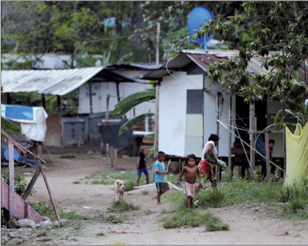
Riesgo. Los infantes correrán el riesgo de participar en trabajo infantil o matrimonio forzado, al igual que aumentarán las cifras de malnutrición.

La región de América del Sur podría ser la más afectada con un aumento de casi el 30 por ciento o casi 11 millones de menores que vivirán en la pobreza monetaria, seguida por el Caribe, con 19 por ciento más o casi