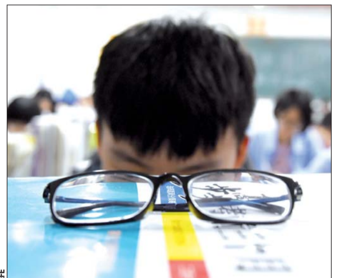
Oposición. La consideración seria a la propuesta para la revocación de visas ha enfrentado la oposición de universidades y organizaciones científicas.

El presidente también está sopesando imponer sanciones financieras y de viaje a funcionarios chinos por la manera como han procedido en Hong Kong, según los funcionarios, que solicitaron el anonimato porque no estaban autoriza-