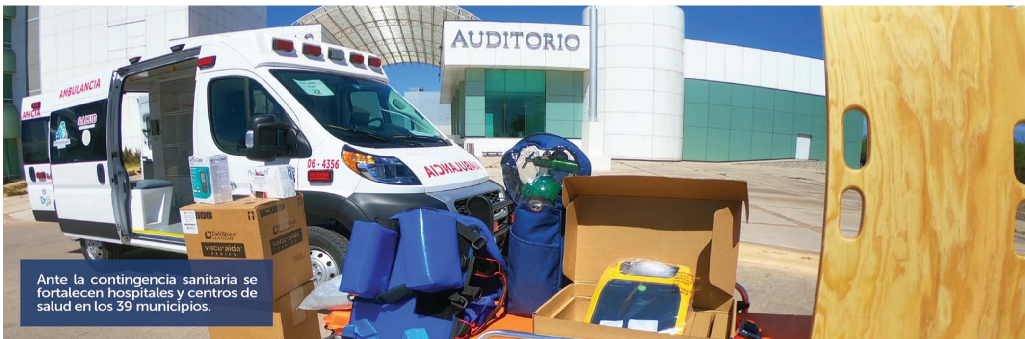
Ante la contingencia sanitaria se fortalecen hospitales y centros de salud en los 39 municipios.

Agregó que el plan general de los lineamientos para el regreso a clases en la nueva normalidad contempla que el viernes 5 de junio concluya el programa Aprende en Casa.