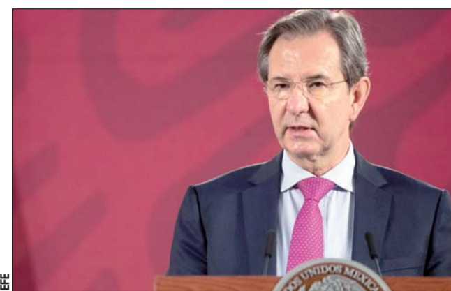
Fecha. El regreso a clases sería únicamente para los estados estén en verde, dijo Esteban Moctezuma.

La ocupación hospitalaria se mantuvo este sábado en el 40% del total de camas generales y del 35% en las que están dedicadas a la terapia intensiva para enfermos graves que necesitan estar intubados, indicó.