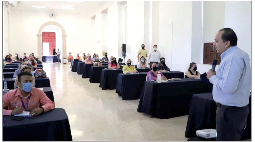
Capacitan a 150 servidores públicos para verificar centros de trabajo.

Agregó que, dependencias como la Comisión del Agua del Estado de Durango, Comisión Estatal de Suelo y Vivienda, Colegio de Bachilleres del Estado de Durango, Universidad Pedagógica de Durango, Secretaría de Turismo, Secretaría de Recursos Naturales y Medio Ambiente, Sistema de Protección Integral de Niñas, Niños y Adolescentes, Instituto Estatal de las Mujeres, Bienestar,