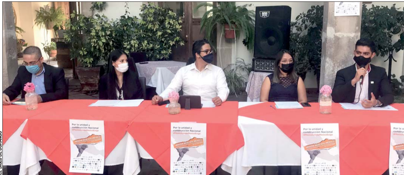
Participación. Agrupaciones duranguenses como Nueva Expresión, Alianza de Maestros y Uniendo Caminos por México, Dilo Bien, y el Instituto Mexicano de Ejecutivos de Finanzas, se sumaron a este movimiento.

dos coordinaciones, una situada en la capital del estado y la segunda en la región Laguna, apuntó.