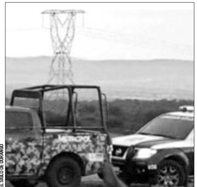
Seguridad. Desde el fin de semana pasado reforzaron la vigilancia en las carreteras.

Finalmente dijo que a pesar de lo ocurrido en la carretera Zacatecas-Durango, la entidad se mantienen con "paz y tranquilidad".