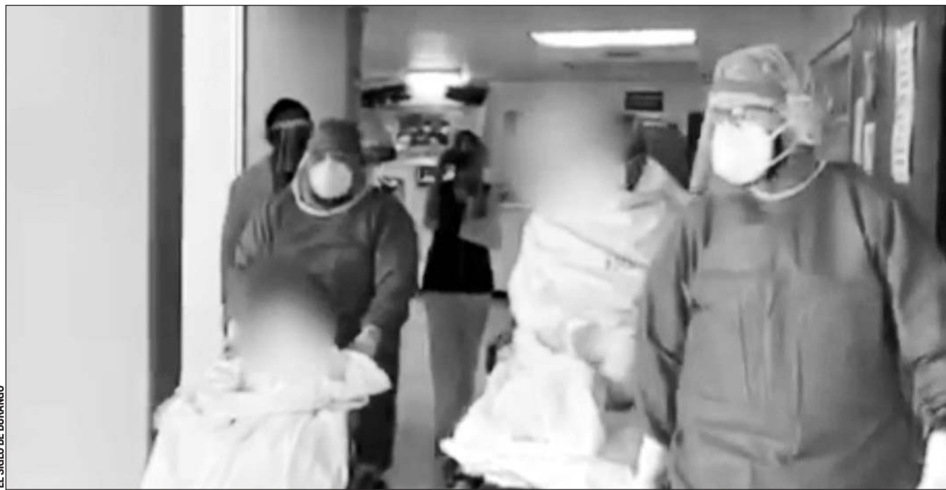
Diagnóstico. La mujer de 62 años padece asma y el varón de 68 vive con hipertensión, a pesar de ello ambos se recuperaron tras dar positivo a Covid-19.