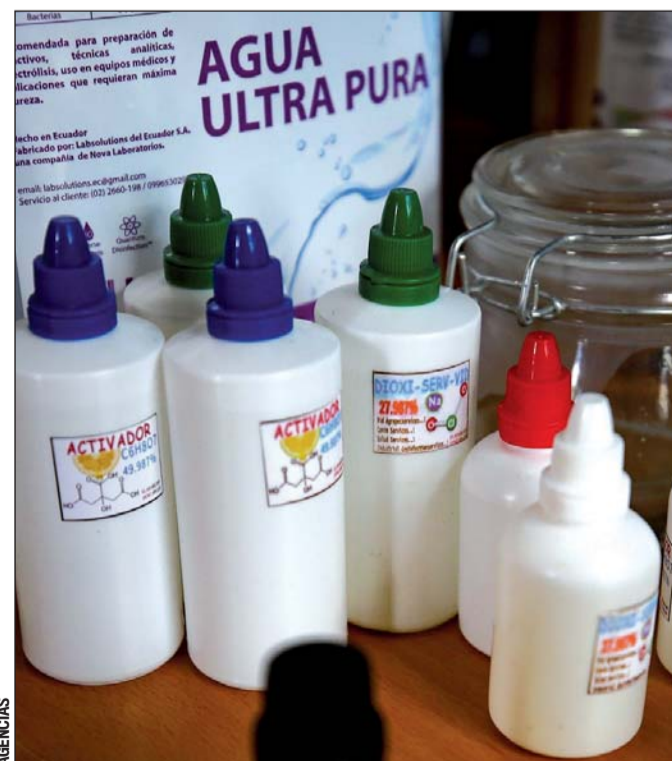
Riesgo. Alertan autoridades de salud a no consumir el dióxido de cloro al ser altamente tóxico.

La Dirección General de Divulgación de la Cien-