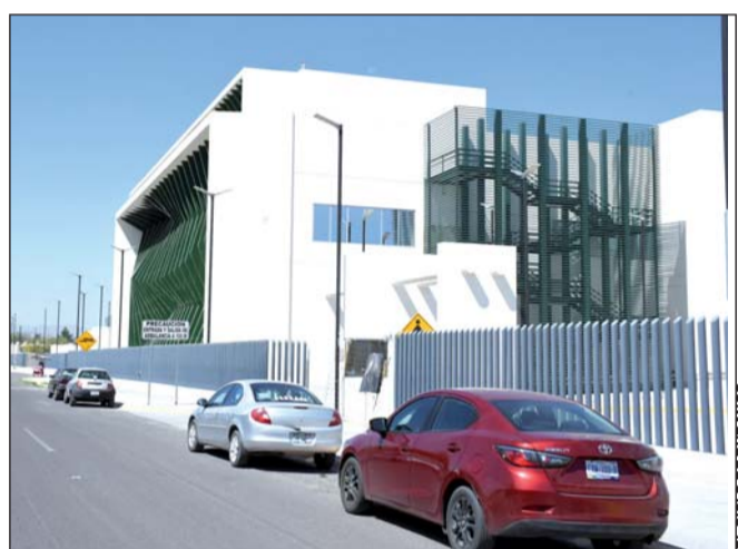
Atención. El Gobierno de Coahuila reporta que buena parte de los pacientes que se atienden en unidades médicas de aquel estado pertenecen a Durango.

Lo anterior lo dio a conocer durante la presentación del Reporte Covid-19 en Coahuila en el que se informó que con corte a las 12:00 horas de ayer 29 de junio, La Laguna era la región del estado donde se concentra el mayor número casos de coronavirus con mil 612 personas afectadas por esta enfermedad, incluidas 83 defunciones. De la cifra total, se dio a conocer que hay 765 casos activos y 764 altas hospitalarias.